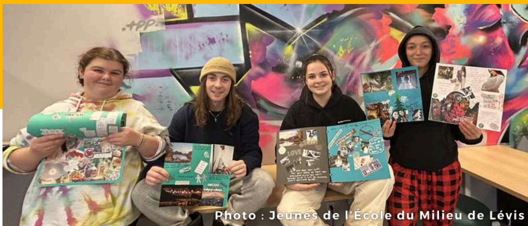
Photo : Jeunes de l'École du Milieu de Lévis